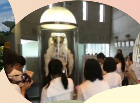
グローバルサイエンスツアー