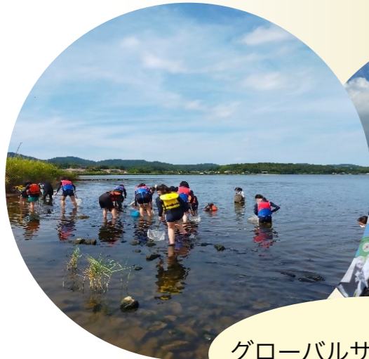
グローバルサイエンスツアー