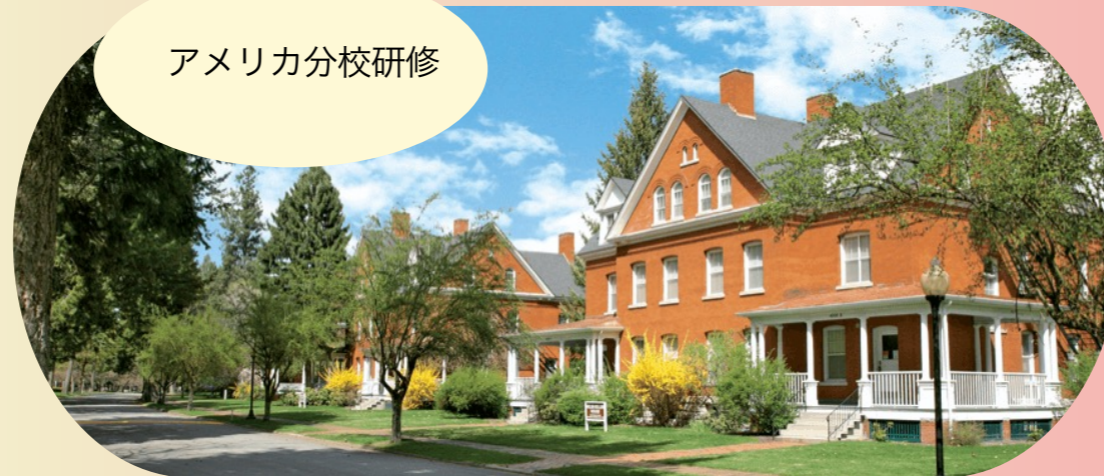
アメリカ分校研修